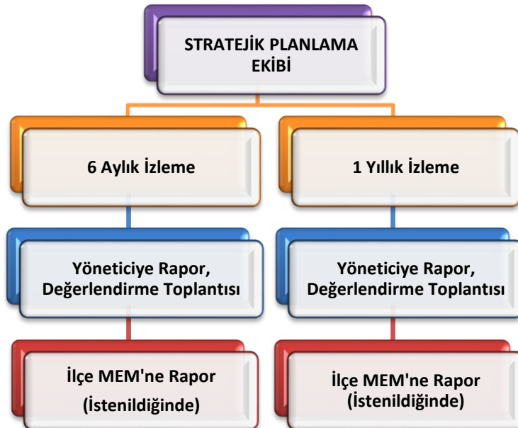
Şekil 8 Stratejik Plan İzleme ve Değerlendirme Modeli

Müdürlüğümüzün 2024-2028 Stratejik Planı İzleme ve Değerlendirme sürecini ifade eden İzleme ve Değerlendirme Modeli hazırlanmıştır. Okulumuzun Stratejik Plan İzleme-Değerlendirme çalışmaları eğitim-öğretim yılı çalışma takvimi de dikkate alınarak 6 aylık ve 1 yıllık sürelerde gerçekleştirilecektir. 6 aylık sürelerde Okul Müdürüne rapor hazırlanacak ve değerlendirme toplantısı düzenlenecektir. İzleme-değerlendirme raporu, istenildiğinde İlçe Milli Eğitim Müdürlüğüne gönderilecektir.